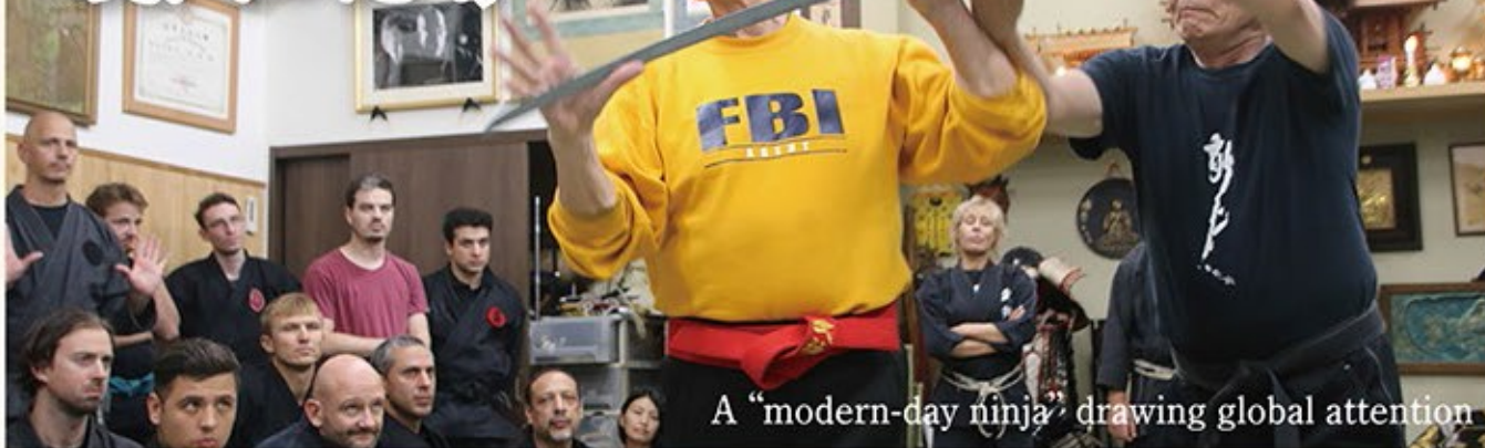
A “modern-day ninja” drawing global attention