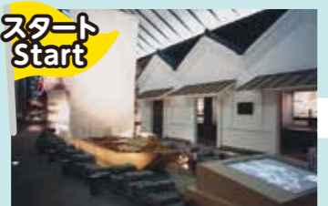
千葉県立関宿城博物館 5P Chiba Prefectural Sekiyado-jo Museum

野田の歴史を勉強したい For those seeking to learn more about Noda's history