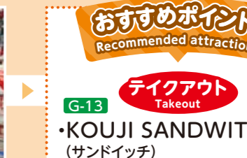
テイクアウト G-13 ・KOUJI SANDWITCH (サンドイッチ) (Sandwiches) ☎04-7124-0313