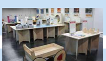
I-5 東京理科大学「なるほど科学体験館」9P MathSci Experience Center, TUS