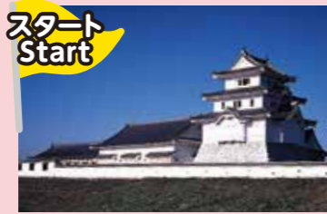
千葉県立関宿城博物館 5P Chiba Prefectural Sekiyado-jo Museum

初めての野田「ここだけは外せない」 My first trip to Noda (must see and must do)