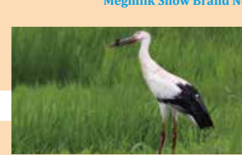
野田市こうのとりの里 10P (自然の中でランチ) Noda Stork Village (Noda Kounotori no Sato) (outdoor lunch)

市内でお買い物 Take home recommended local products and sweets 推奨物産品やスイーツをお土産に