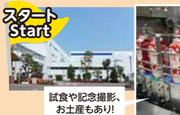
雪印メグミルク野田工場 9P Megmilk Snow Brand Noda Plant

おいしいものを食べてみたい Want to eat something good