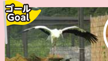
野田市こうのとりの里 10P Noda Stork Village (Noda Kounotori no Sato)