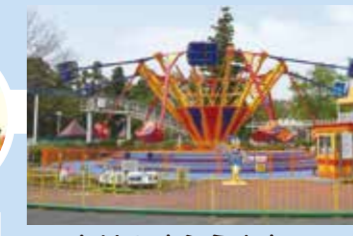
もりのゆうえんち 8P Mori no Yuenchi Amusement Park