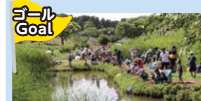
「野田市こうのとりの里」10Pまたは、「三ツ堀里山自然園」11P Noda Stork Village (Noda Kounotori no Sato) or Mitsubori Satoyama Park