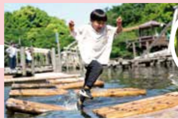
清水公園 8P SHIMIZU KOUEN