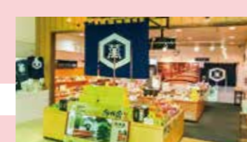
キッコーマンもの知りしょうゆ館 9P Kikkoman Soy Sauce Museum (Monoshiri-Shoyu Kan)