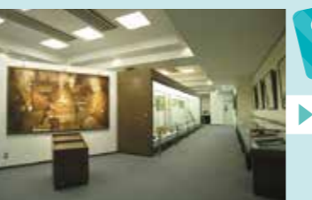
関根名人記念館 5P Sekine Meijin Memorial Hall