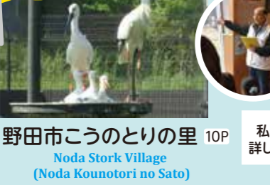
野田市こうのとりの里 10P Noda Stork Village (Noda Kounotori no Sato)