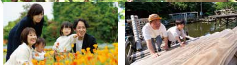
四季の花を満喫「花ファンタジア」

※新型コロナウイルス感染症の感染防止のため休館している施設があります。開館状況はお出かけ前に各施設にご確認ください。