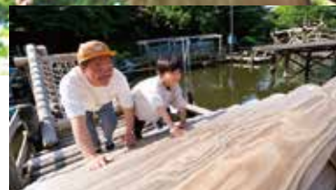
スリルと興奮がいっぱい「フィールドアスレチック(要予約)」