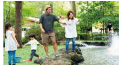
自然感覚の釣り堀「ニジマス釣り」