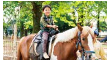
かわいい動物と触れ合う「ポニー牧場(要予約)」