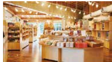
野田市のおみやげが買えるショップ「Ruska」