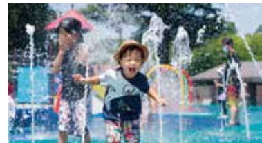
大冒険の1日の始まり「アクアベンチャー(要予約)」