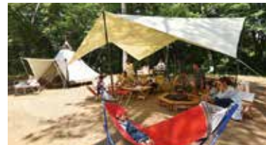
自然に囲まれて宿泊「バンガロー・オートキャンプ場(要予約)」