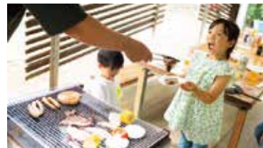
屋根付きでいつでも楽しめる「バーベキュー(要予約)」